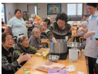
形を整えたら、再び湯銭 にかけます