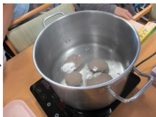
火が通ったらできあがり です♪