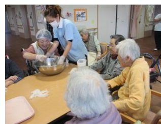
「こんにゃくの素」を入 れてさらに練ります。