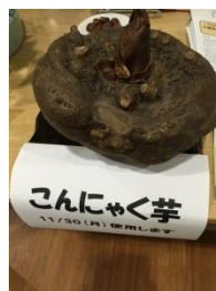
とても大きな こんにゃく芋 でした！