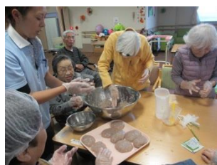
みんなで形を整えていき ます。