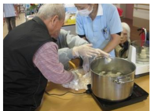
切り分けたこんに ゃく芋を湯銭にかけ ます。