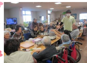
細かくなったこんに ゃく芋です