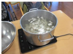
やわらかくなるまで 待ちます。とても時間 がかかりました