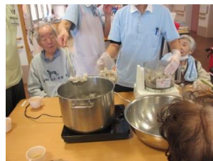
やわらかくなった芋 をフードプロセッサー にいきます。