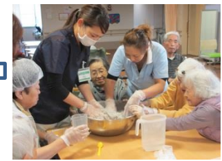
ぬるま湯を入れなが ら練ります

大きなこんにゃく芋を見た時は、本当にこれがこんにゃく になるのか、半信半疑でしたが、作り方を知っていらっし やる方もいて、ご指導をいただきました。皆様のご協力の もと、無事にこんにゃく作りが成功しました。出来上がった こんにゃくは、お味噌をつけておいしくいただきました。