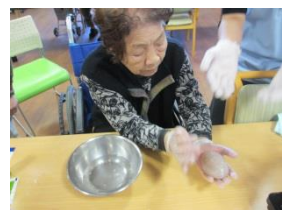
こんにゃくらしく なってきました！