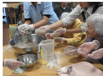
適度な柔らかさになった ので形を整えます。